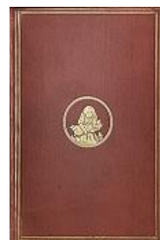
Alice in Wonderland van 1965.